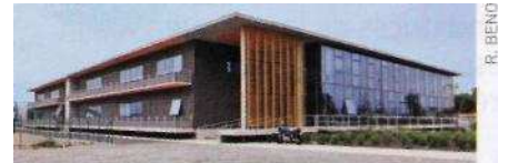
Le bâtiment de l'ITAV sur le site du Cancéropôle.

de la plateforme Génopôle Toulouse Midi-Pyrénées. L'ITAV, lien entre la recherche et la santé, est pour lui « une structure totalement adaptée à une entreprise comme Dendris ».